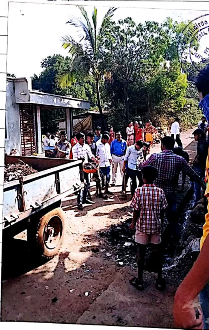
विशेष शिबीरान पोखळे येथे शब्दछता करतोका स्वयंसेवक